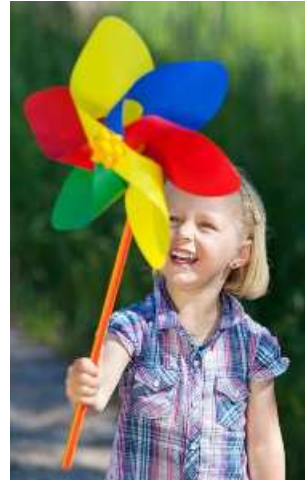
Die Kraft des Heiligen Geistes - ein einfaches Windrad kann sie widerspiegeln, wenn sich die Flügel scheinbar von selbst drehen.

Pfingsterlebnisse und Coronaerfahrungen – manches ähnelt sich. Dennoch gibt es einen wesentlichen Unterschied: