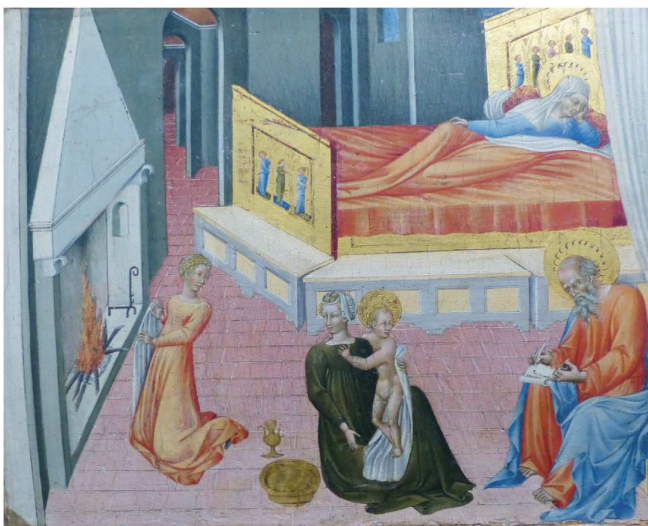
Giovanni di Paolo (1417–1482), Geburt Johannes des Täufers

Erst als Elisabeth Johannes geboren hatte, konnte er wieder reden. Und das geschah so: Die Verwandten und Freunde, die gekommen waren, um den Eltern zu gratulieren, fragten Zacharias, wie das Kind heißen sollte. Zacharias konnte nicht antworten. Erst als er den Namen des Kindes – Johannes – auf eine Tafel geschrieben hatte, hatte er seine Stimme wieder.