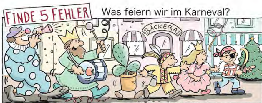
Apfel, Kaktus, Banane, BäckerAI, Weihnachtsbaum

Karneval und Fastenzeit gehören also ganz eng zusammen, doch viele wissen das heute leider nicht mehr. Sie feiern Karneval, doch an die Fastenzeit denken sie nicht. Das ist eigentlich schade.